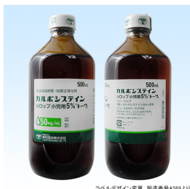
ラベルデザイン変更 製造番号A569より