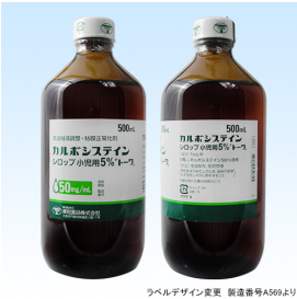
ラベルデザイン変更 製造番号A569より